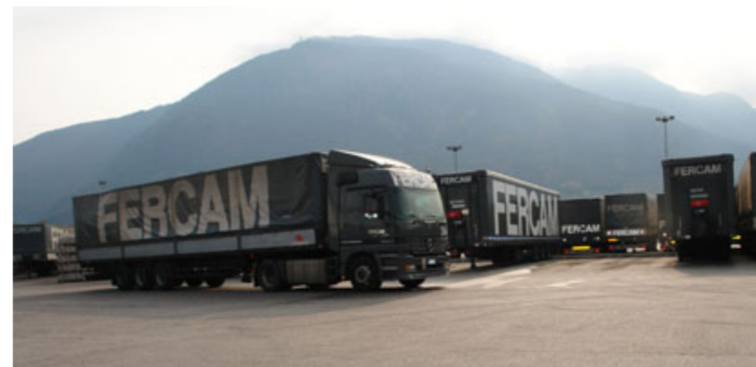
Großer Zuspruch: International renommierte Unternehmen greifen auf ECOsens, das System von Fueldata, zurück.